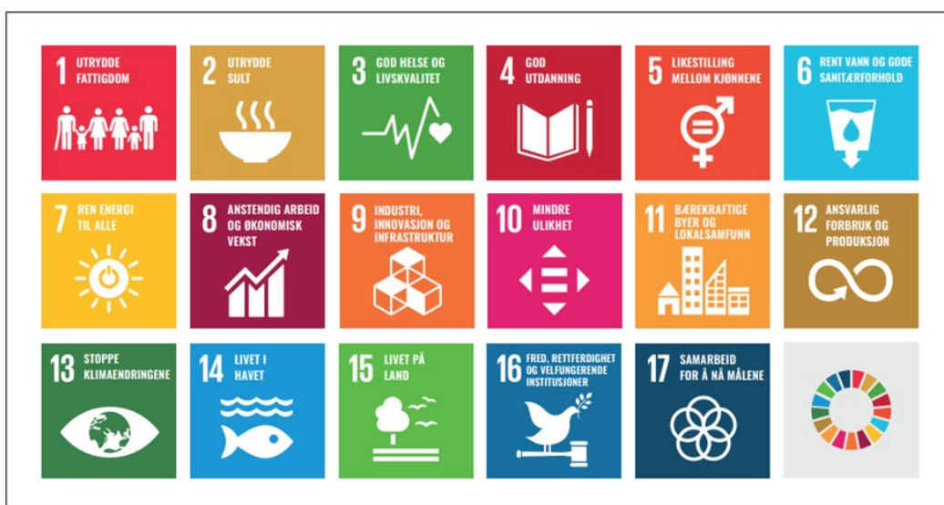
Figur 1 FNs bærekraftsmål.

Bærekraft defineres av FN til å inkludere tre dimensjoner: klima og miljø, økonomi og sosiale forhold. FNs bærekraftsmål er verdens felles arbeidsplan for å utrydde fattigdom, bekjempe ulikhet og stoppe klimaendringene innen 2030, se figur 1.