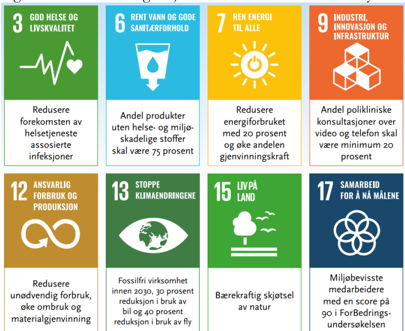
Figur 6: Felles klima- og miljømål vedtatt av de fire RHF-styrene høsten 2021, oppdatert i 2024.

Felles klima- og miljømål for spesialisthelsetjenesten kommer i tillegg til lokale mål i helseforetakene. Helseforetakene har ulike utgangspunkt for potensiell reduksjon av CO 2 e-utslipp. Det er derfor hensiktsmessig at hvert enkelt helseforetak vurderer hvilke tiltak som iverksettes for å redusere 40 prosent utslipp innen 2030, jf. utvikling av utslippbaner. Statens veileder for samfunnsøkonomiske analyser skal benyttes for å sikre gode kost-nytte vurderinger.