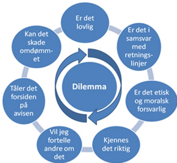
Figur 7: Dilemmasirkelen, kilde: Kvalnes, Øverenget 2012

hensiktsmessig verktøy for å øve opp den enkeltes evne til å vurdere etisk forsvarlighet. Dilemmasirkelen kan benyttes når de ulike problemstillingene diskuteres.